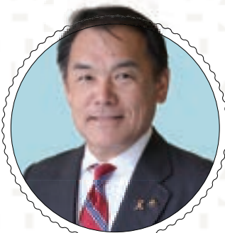
みね たつろう ◎1960年唐津生まれ。 1995年唐津市議会議員に初当選し、佐賀県議会議員を経て、2017年に唐津市長に就任。2025年に3期目の当選を果たす。

坂本 「やきものまち」として知られる唐津において、唐津焼は地域の文化や暮らしを象徴する存在です。市長は、その魅力をどのように捉えたいらっしゃいますか。